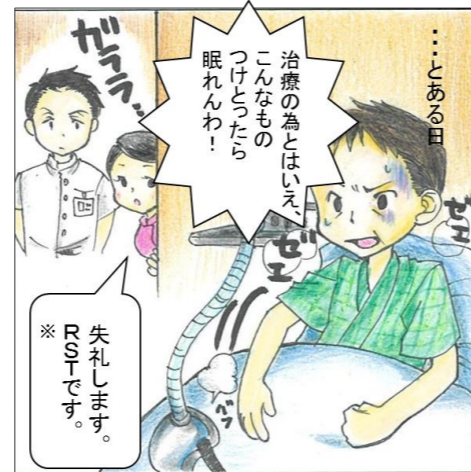
※RST...呼吸ケアサポートチーム