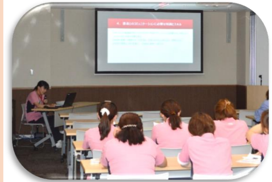
< 研修会の様子 >