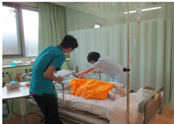
《病棟看護実習の様子》

教える側である当院の看護師達にとっても、必死にノートにメモを取る学生達の姿を見て初心に帰ることができて良い刺激になりました。看護実習は10月、11月、12月も実施予定です。未来の看護師達のために実りのある実習になるように職員一同取り組んでまいります。院内で見かけた場合は、是非温かい目で見て頂ければ幸いです。