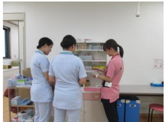
《外来看護実習の様子》