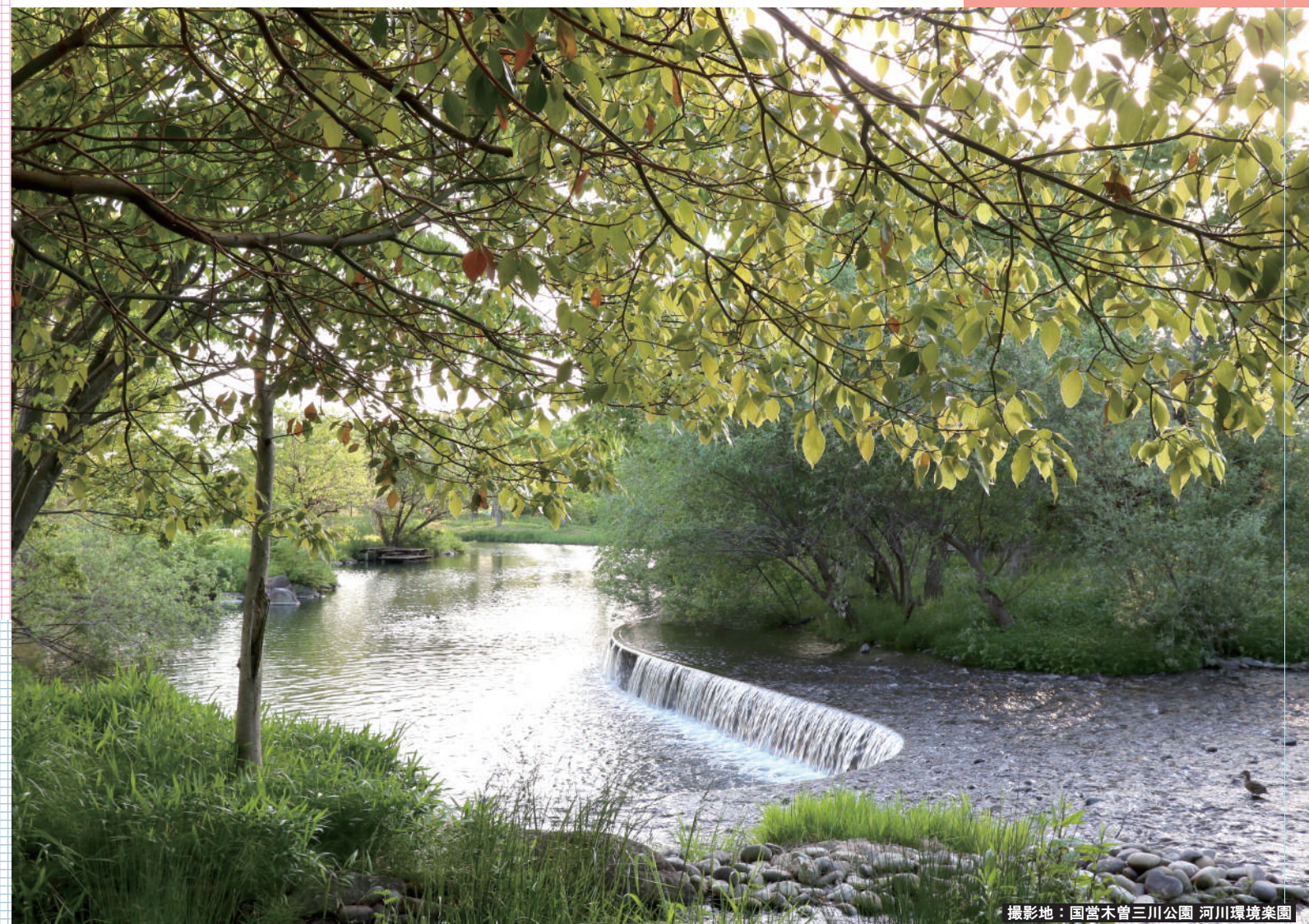
撮影地：国営木曾三川公園 河川環境楽園