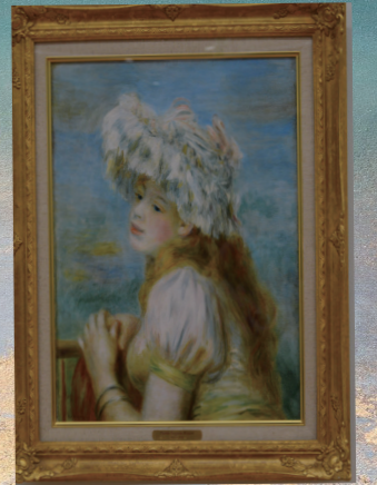
《ピエール・オーギュスト・ルノワール 1891年 油彩》

白いレースの帽子の清々しさは、夢見るような表情を浮かべた少女の甘美な魅力を引きだしています。ルノワールは、自らの選んだ帽子や衣装をモデルに提供することもあったようです。女性像にいつそう生き生きとした魅力をもたらすうえで、帽子をはじめとするファッションは、ルノワールにとってきわめて重要なものだったのです。総合待合付近にご覧いただけますので、ぜひご覧ください。