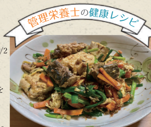
管理栄養士の健康レシピ

夏場は暑さで食欲が低下し、麺類などで簡単に食事を済ませる事もあり、たんぱく質が不足しがちです。たんぱく質は、骨や筋肉、血液など身体を構成する最も重要な栄養素です。すべての細胞では、合成と分解が常に繰り返されており、たんぱく質は絶えず必要とされていますが、蓄えられないため、毎食均等に摂る必要があります。このレシピは1食分のたんぱく質がしっかり補給できるだけでなく、骨や筋肉増強に効果的なカルシウムやビタミンDも豊富に含まれています。