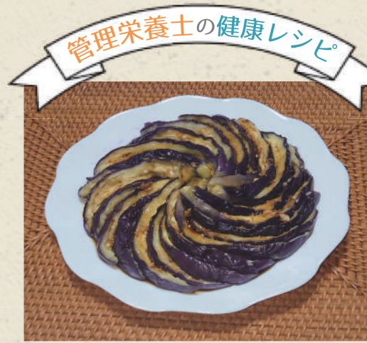
管理栄養士の健康レシピ

紫色の皮にはポリフェノールの一種で、強力な抗酸化作用のあるナスニンが豊富です。ガンや生活習慣病のもとになる活性酸素を抑える力が強く、肌トラブルを防ぎ、老化やがんを予防。また、コレステロールの吸収を抑える作用や肝臓の働きを活性化させる効果もあるそうです。