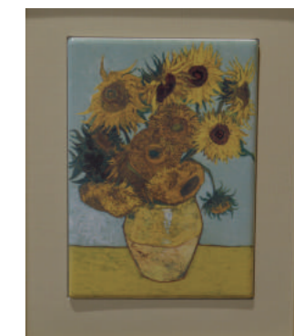
《フィンセント・ファン・ゴッホ 1888-1890年 油彩》

当院にもサイズの違うものなども含めて8点のひまわりが飾られていますので、興味がおありの方は探してみたいかがでしょうか。